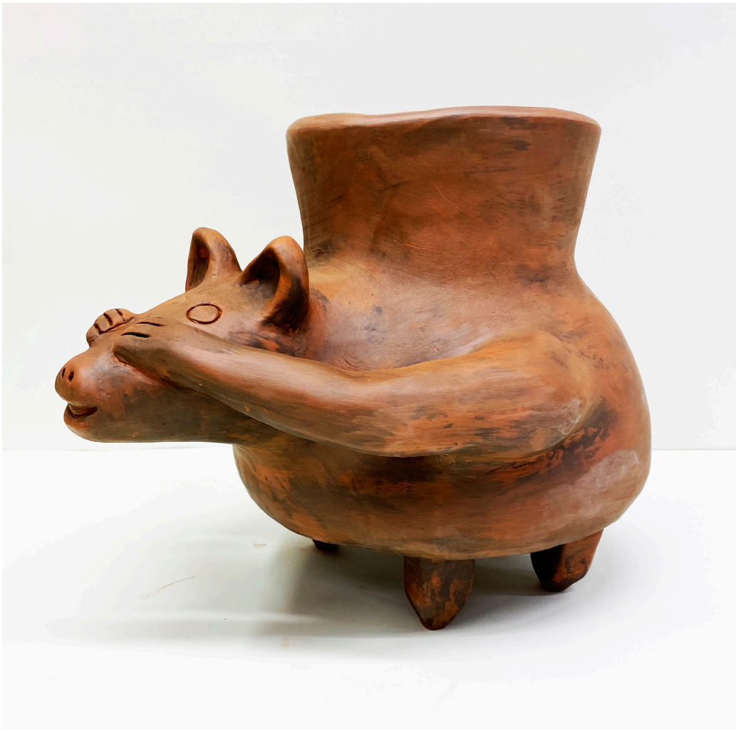
M. a LUZ MIRÓN SANGUINO Arcilla roja con engobe negro. Altura 25 cm.