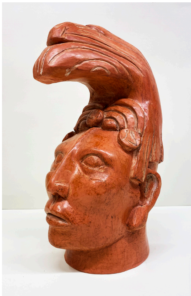
ELENA POLO RUIZ Arcilla roja patinada. Altura 39 cm.