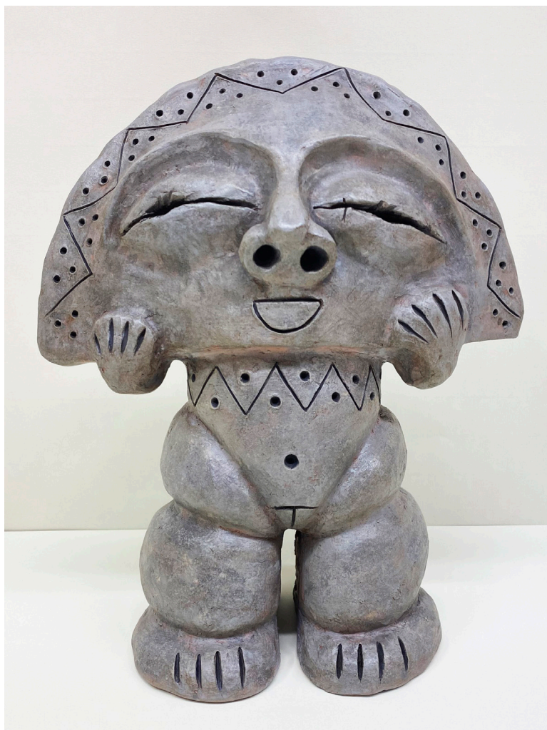
AMELIA BUENO TIMÓN Arcilla roja policromada. Altura 27 cm.