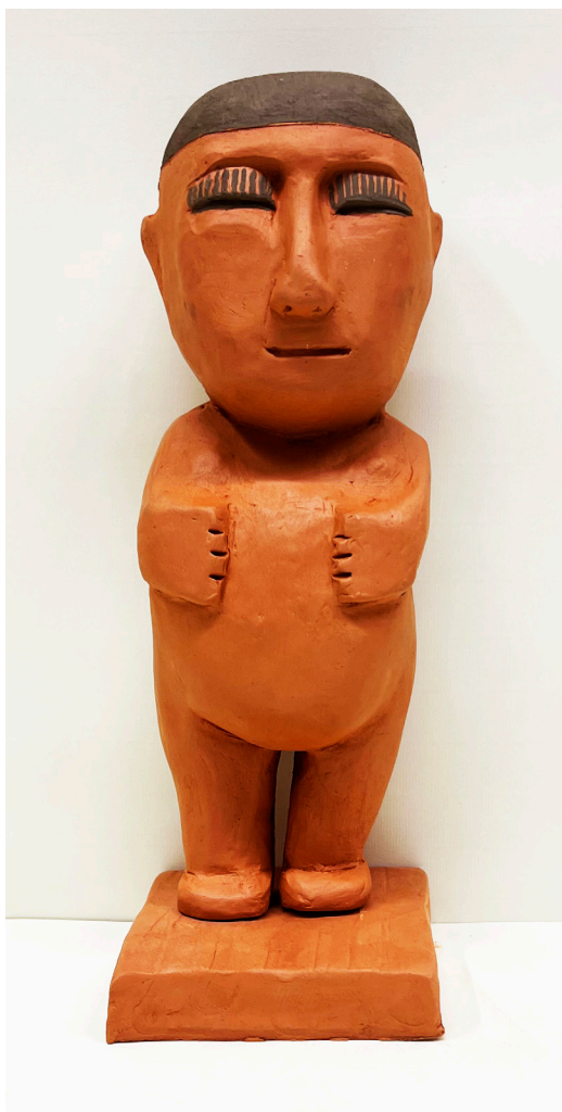
ANA M. a GÓMEZ FERNÁNDEZ Arcilla roja con engobe negro. Altura 37 cm.