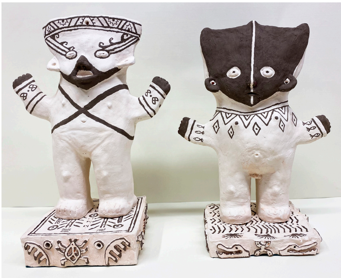
BIENVENIDO TRANCÓN MÁRTEL Arcilla roja con engobes blanco y negro. Altura 41 y 42,5 cm.