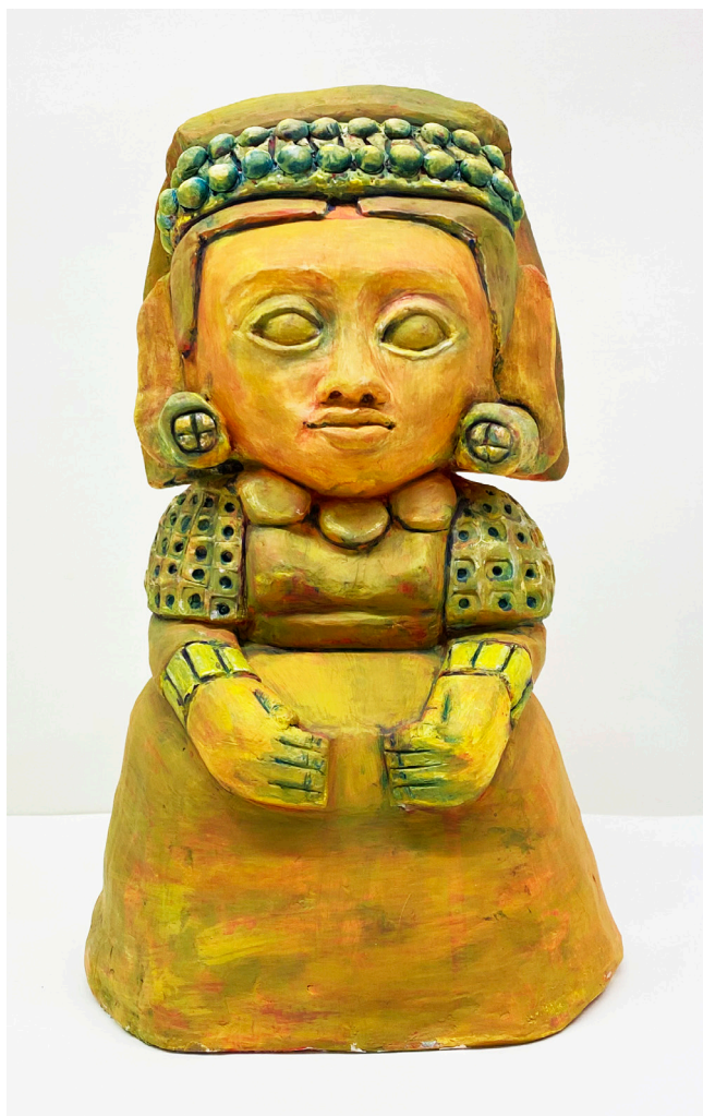
M. a JESÚS GONZÁLEZ CASADO Arcilla roja policromada. Altura 32 cm.