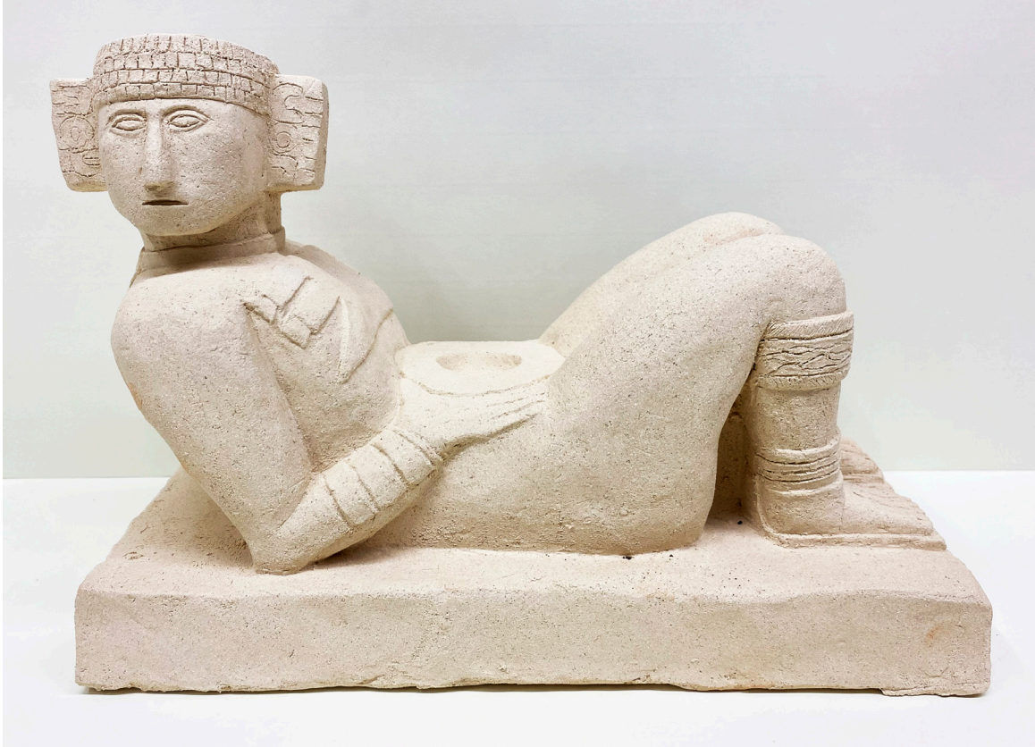
ABEL MARTÍN ORIVE rcilla refractaria blanca. Altura 23 cm.