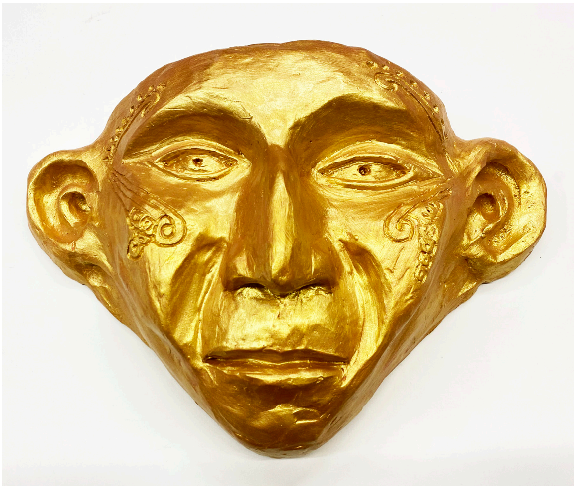
TERESA GAMONAL Arcilla roja patinada. Altura 22,5 cm.