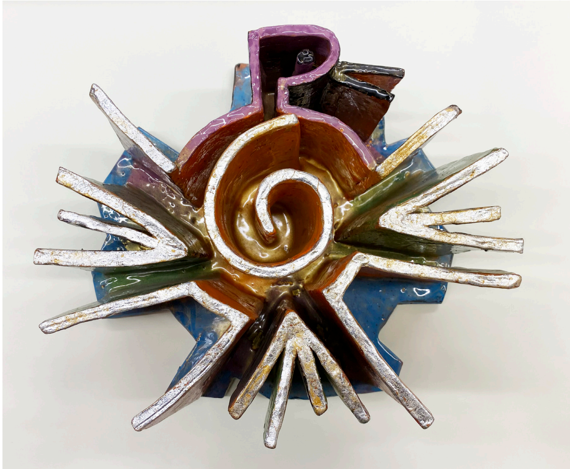
JOSE ÁNGEL GIL QUINTERO Arcilla roja esmaltada. Altura 37 cm.