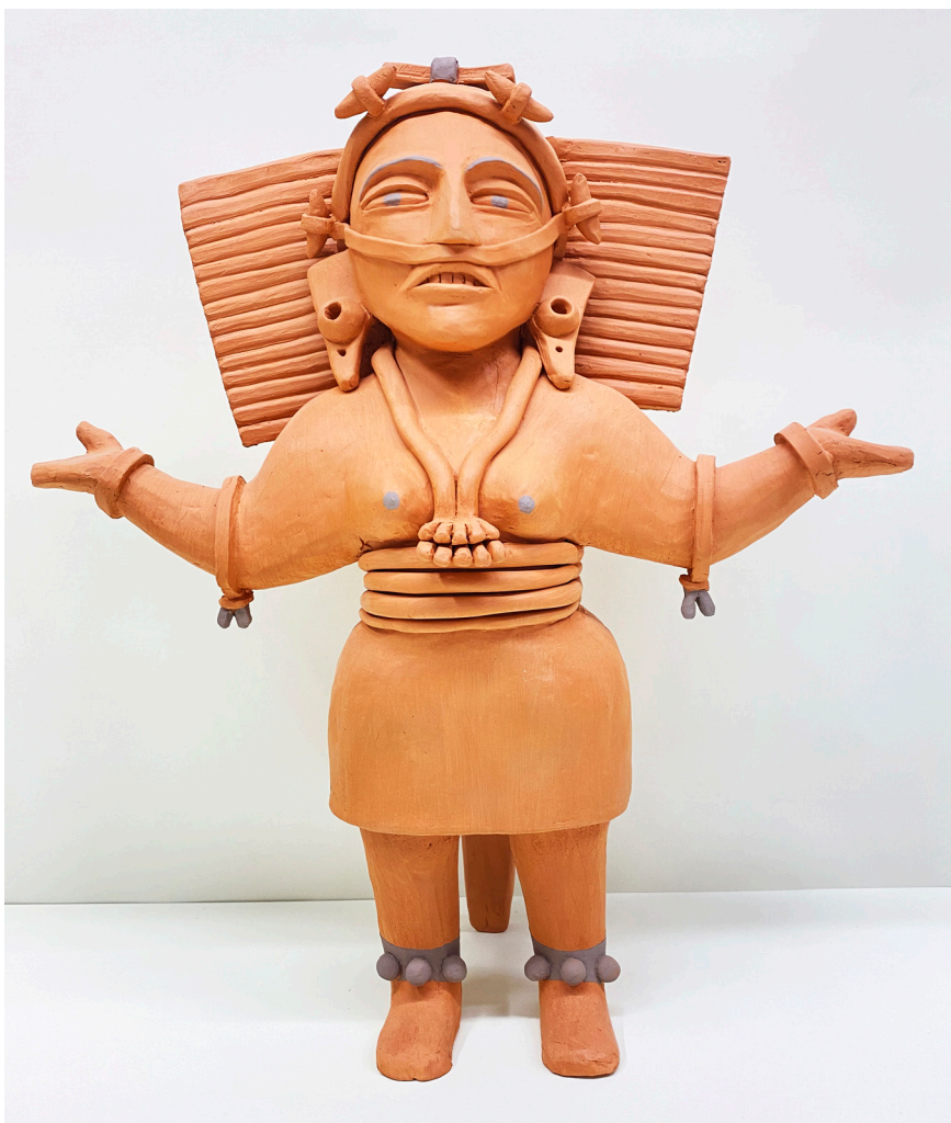
OSCAR GARCÍA MENÉNDEZ Arcilla roja con engobe gris. Altura 50 cm.