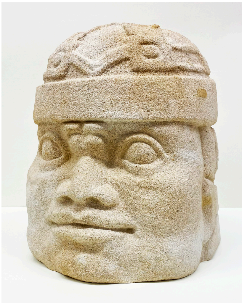
JULIA GUADALUPE MARTÍNEZ SANTANA Piedra de Villamayor. Altura 35 cm.