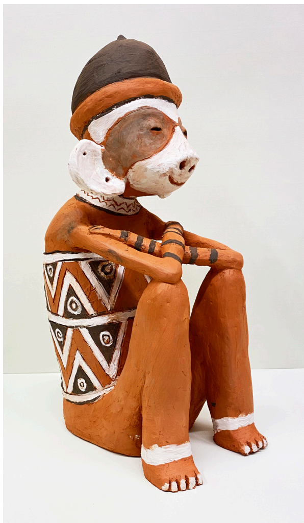
CARMEN CEMBRANO REDER Arcilla roja con engobes blanco y negro. Altura 39 cm.